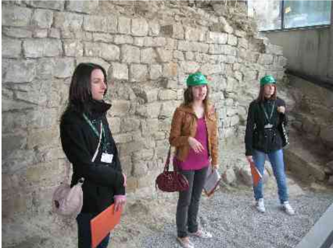
Razlaga pred obzidjem (muzej je za obiskovalce odprt samo ob posebnih priložnostih)

Za Rimljane obzidje ni imelo le obrambni, pač pa morda še pomembnejši simbolični ali celo čarobni pomen: njegov potek so načrtali z arhaičnim bronastim plugom ob prisotnosti svečnikov in avgurjev - vedeževalcev. Obzidje je ločevalo mesto od pogosto napadalnega in nevarnega zaledja, meščane od sovražnikov, dobro od zla. Romul, ustanovitelj Rima, je celo brata Rema kaznoval s smrtjo, ko ga je ta izzival, tako da je preskočil brazdo, kjer naj bi se dvigovalo obzidje. Naselbina brez obzidja pravzaprav ni bila niti pravo mesto, pač pa samo vas - pagus .