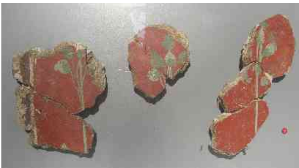
Tako so bile okrašene stene rimske hiše

Ko so lastniki zapustili tovarno, so ta prostor uporabili kot nekropolo oziroma pokopališče; to se je v skladu z rimsko zakonodajo iz higienskih razlogov nujno moralo nahajati izven mesta. Prva grobnica, iz 2. stol. po Kr., je bila razkošna, kar dokazuje, da je bil pokojnik (morda član rodbine, ki je prej imela v lasti domus ) zelo bogat. Na sredini zamejene parcele se je nahajal okrašen štirikoten spomenik, kakršne poznamo iz Akvileje; obdajala ga je izdelana kamnita ograja, ki je konkretno ponazarjala simbolično razmejitev med svetom živih in kraljestvom mrtvih.