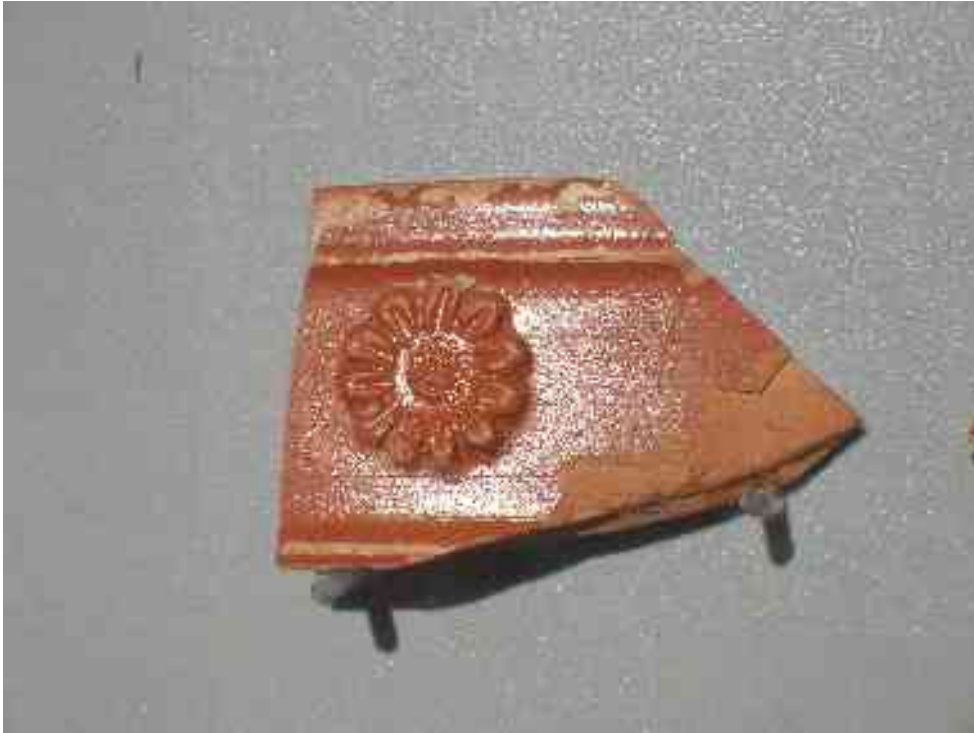
Tudi v Trstu so Rimljani na mizi pri obedu imeli lepo okrašene vaze