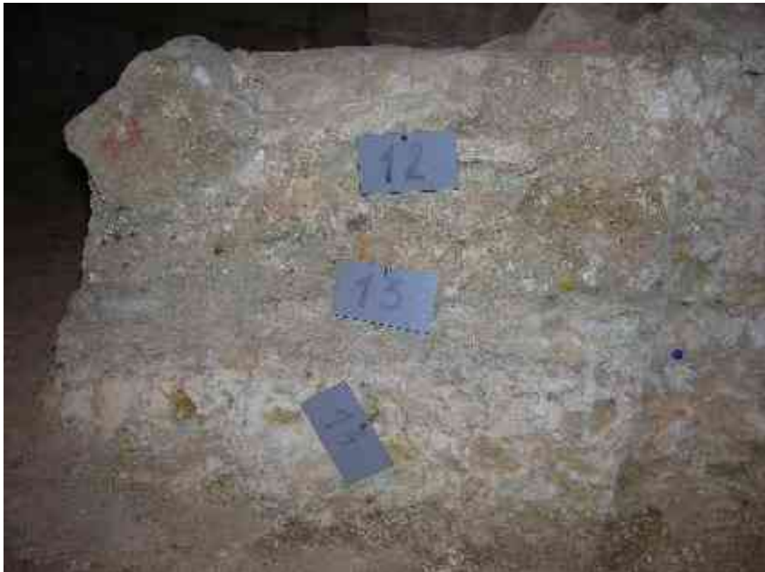
Primer stratigrafskih plasti