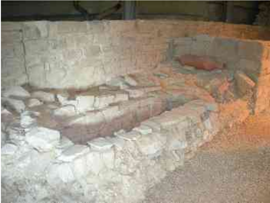
Zid in grobnica

V prvi fazi je bila domus : razkošni stanovanjski objekt izven mestnega obzidja, nedaleč od gledališča. Sobe so bile velike in krasile do jih freske, katerih ostanke, skupaj z drugimi predmeti izvrstne izdelave, lastjo njenih gospodarjev, si lahko ogledamo v vitrinah ob vhodu v muzej. V hiši so imeli tudi vodnjak, ob katerem so se hladili v poletnih večerih (arheologi so v njem našli orehove lupine), in celo kopalnico s školjko in tekočo vodo. Znano je namreč, da so Rimljani sloveli kot izredno čisti ljudje. Kasneje so z dograjevanjem zidov bivalne prostore pomanjšali in v stavbi so se ukvarjali samo še z gospodarskimi posli: verjetno je šlo za majhno tovarno, morda pralnico ali strojarnico, v kateri so kožo predelovali v usnje. Iz te faze so se ohranili ostanki dveh jaškov. Stranišče se je kasneje zanašilo in spremenilo v odtočno gnojno jamo.