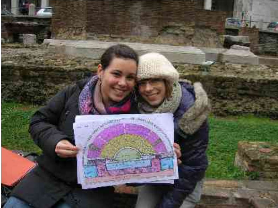
Tloris gledališča in nasmejani vodički

Ker v Trstu ni bilo niti amfiteatra niti cirkusa, je verjetno, da so se v gledališču vse do 3. - 4. stol. vršile tudi gladiatorske igre. Gledališče se je v skladu z rimsko tradicijo nahajalo izven mesta, saj bi lahko v njem prišlo do izgredov, kot se še danes dogaja na nogometnih stadionih. Pogled na dogajanje na odru je še naknadno obogatilo morje, ki se je širilo tik za gledališčem.