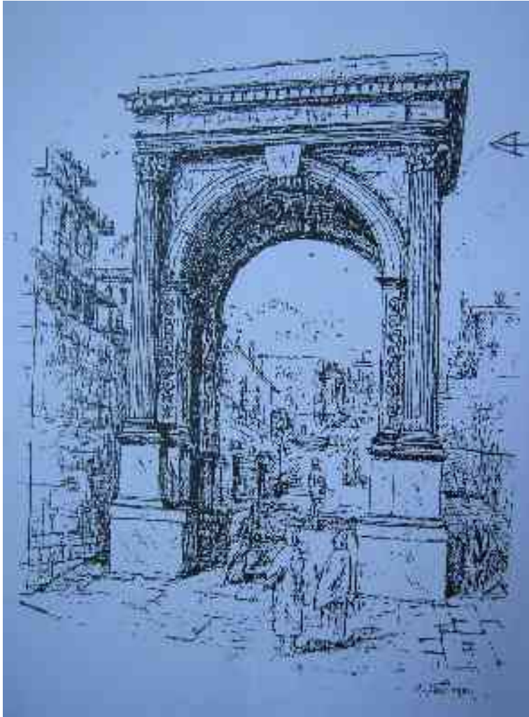
Rekonstrukcija štiristebrnega spomenika