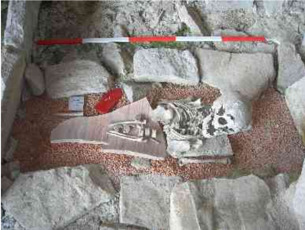
Okostje rimske deklice

otroki izstopajo ostanki šest ali sedem let stare deklice (spol določamo na podlagi lobanjskih kosti), katere starši so bili tako revni, da niso imeli niti amfore, v katero naj bi jo vtaknili v skladu s pokopno tradicijo, pač pa so jo samo položili na veliko črepinjo; kot nekateri drugi otroci pa ima deklica na prsih mozaični kamenček, ki naj bi jo varno spremljal na poti v onostranstvo. Deklica ni bila kristjanka (v tej nekropoli ne beležimo krščanskih pokopov) in ni jasno, kaj naj bi pomenil ta grobni pridelek; ker pa je kamenček podoben kocki, bi lahko simboliziral igro usode, ki se ji morajo vsi smrtniki ukloniti.