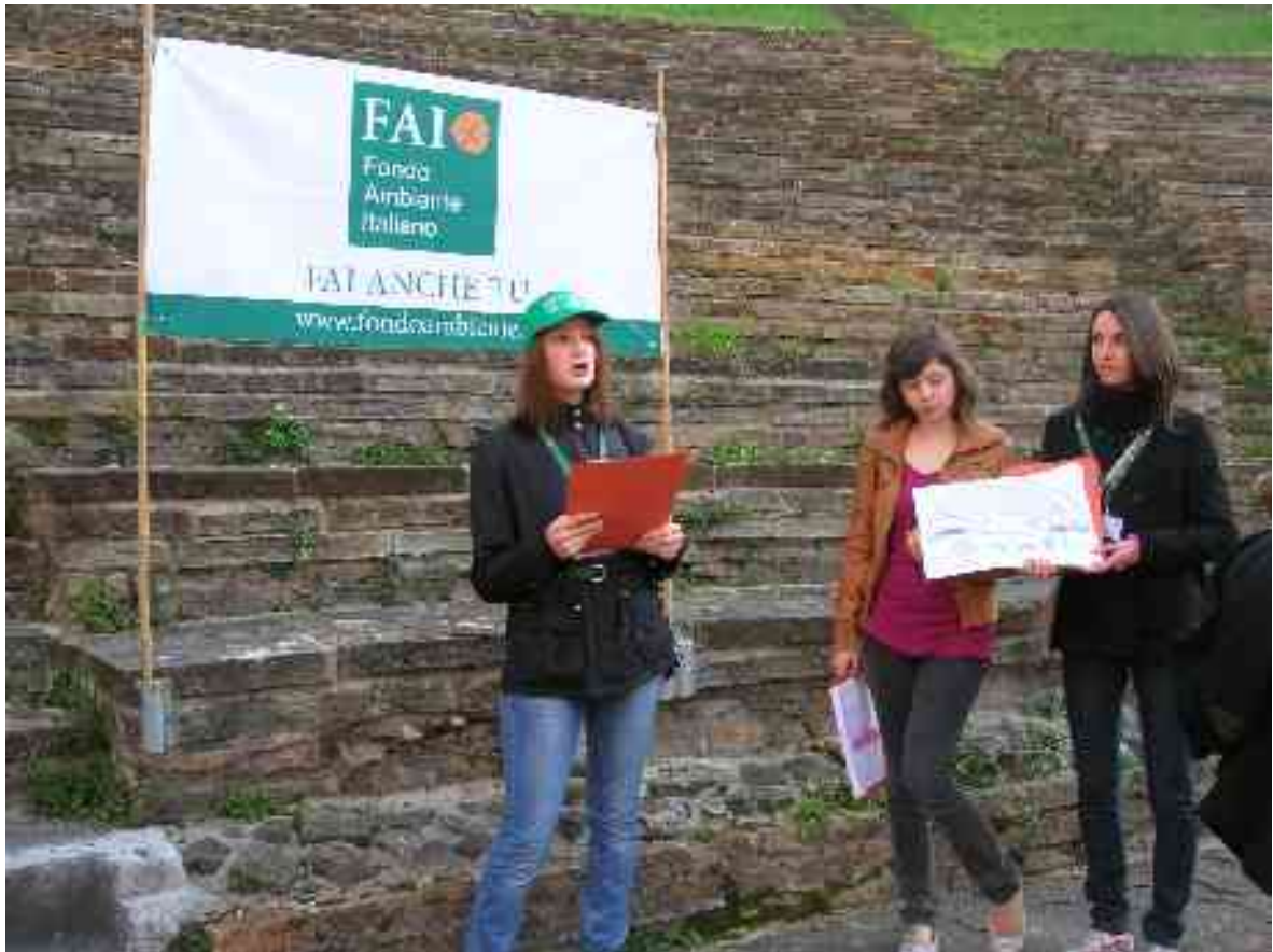
Nekatere vodičke iz I. klasičnega liceja, v ozadju simbol FAI