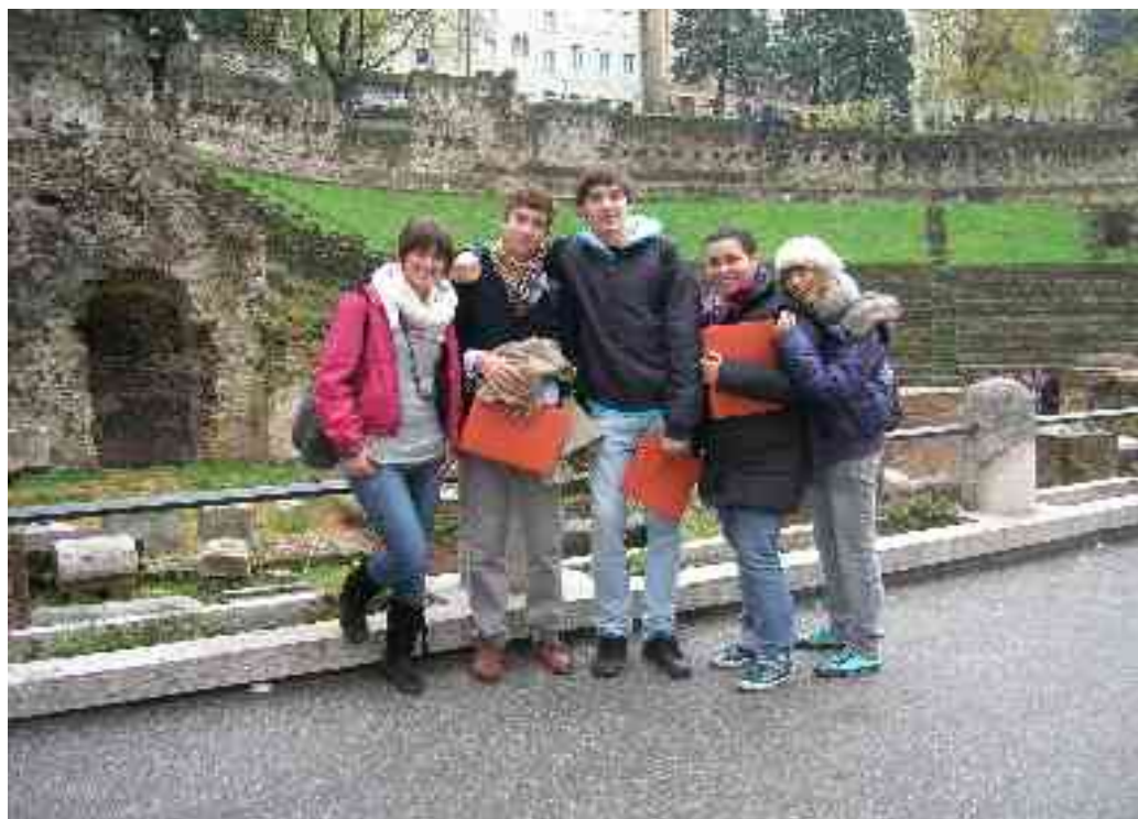
Na sliki nekateri vodiči iz V. v.g. pred rimskim gledališčem