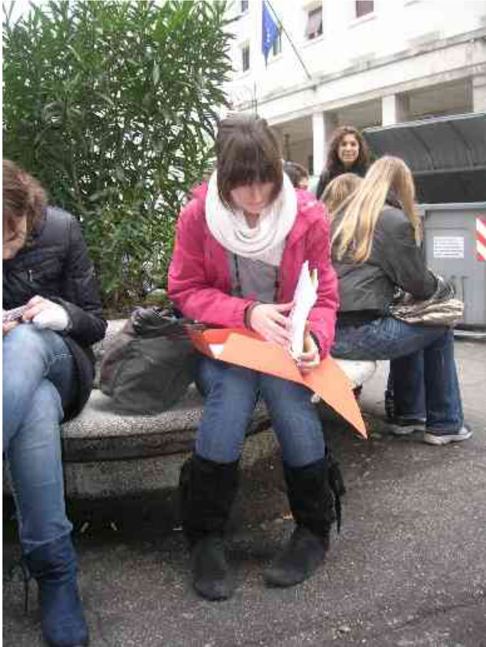
Še zadnje priprave pred “profesionalnim nastopom”