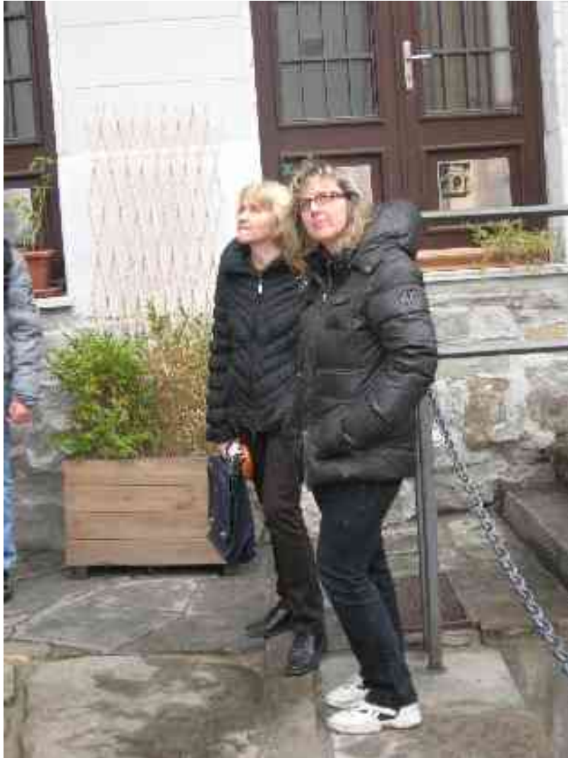
Restavracija in profesorici, ki zavzeto poslušata dijake

V 4. stol. (sočasno z zadnjo fazo grobišča iz Ulice Donota) so Rihardov slavolok utrdili z obrambno strukturo, ki je danes še vidna nekaj metrov pod njim: postal je vrata v zgornji del mesta, kamor se je ljudstvo zatekalo pred napadalci v 4. in 5. stoletju.