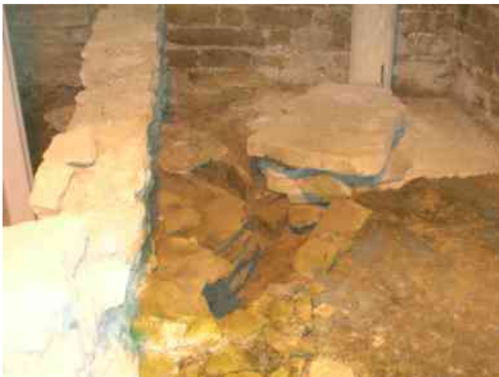
Školjka v rimskem stranišču oziroma kar od nje ostaja ...