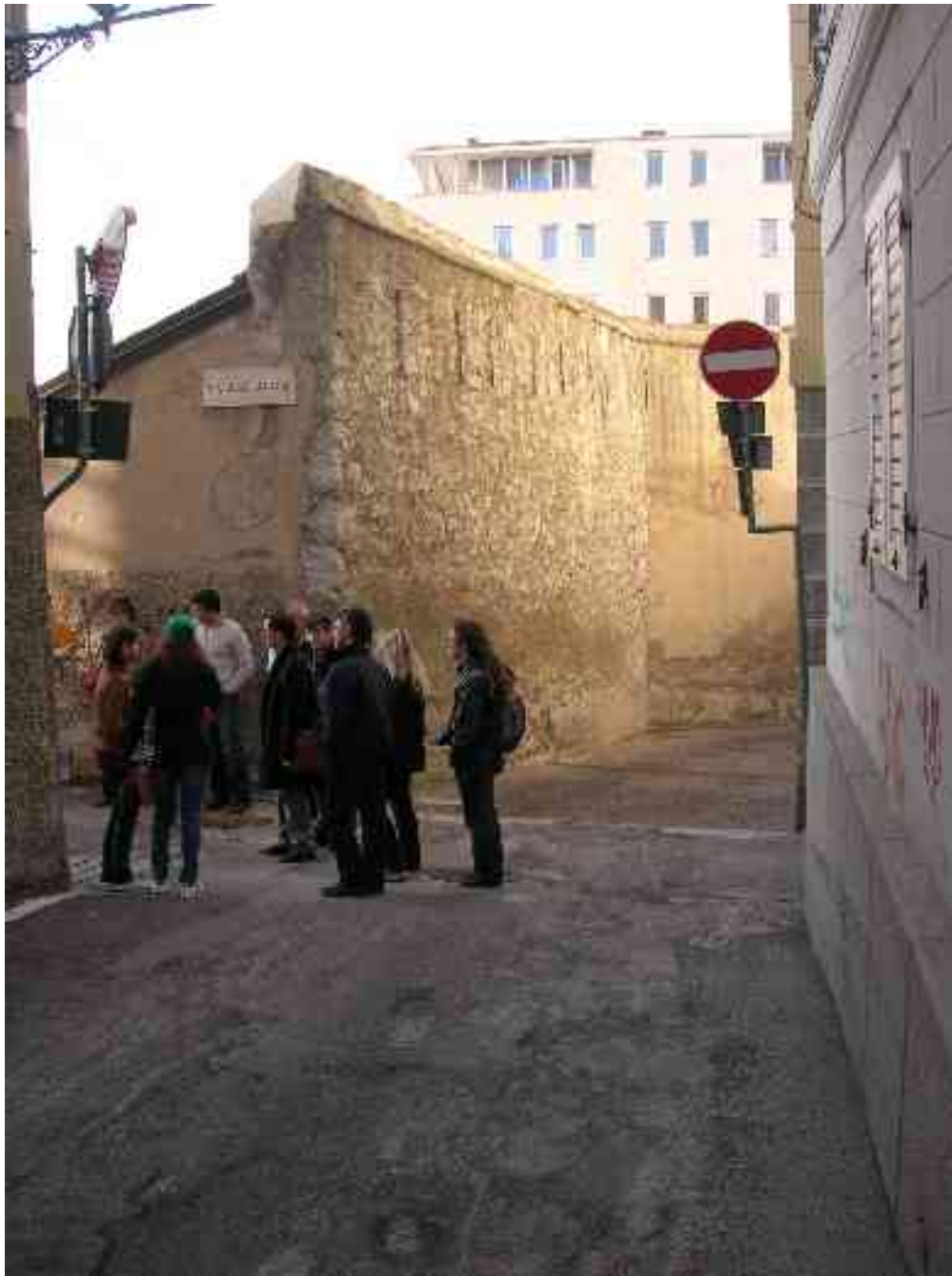
... in decumanus , ki se z njim križa.

Izvor imena spomenika, ki ga poznamo kot "Rihardov slavolok" ( Arco di Riccardo ), ni znan. Povsem legendaren je podatek, ki slavolok povezuje s Karlom Velikim (" re Carlo "), ki naj bi mu Tržačani ta spomenik posvetili, ko naj bi cesar dospel v naše mesto. Veliko verjetnejša je hipoteza, ki to ime povezuje s cestno osjo cardo ; ni izključeno niti, da je spomenik dobil ime po neki srednjeveški magistraturi oziroma javni službi (" ricario "), ki je imela sedež v bližini spomenika. Rihardov slavolok je nedvomno edini rimski arhitekturni objekt, ki je bil viden in vsem znan tudi v najtemnejših letih tržaške zgodovine, čeprav so del le-tega kasneje vgradili v bližnjo stavbo (restavracijo). Z gotovostjo vemo tudi, da ne gre za mestna vrata: ostanki mestnih vrat, ki so se odpirala v republikanskem obzidju, se namreč nahajajo pod samo stavbo; ko je Rihardov slavolok nastal, v obdobju razcveta v drugi polovici 1. stol. po Kr., obzidje ni več imelo obrambne vloge. Pod njim je tekla cesta, ki je vodila od Sv. Justa proti morju (že omenjeni cardo ). Spomenik je po vsej verjetnosti pomenil mejo med starejšim (gornjim, versko-upravnim) in novejšim (spodnjim, obmorskim) delom mesta.