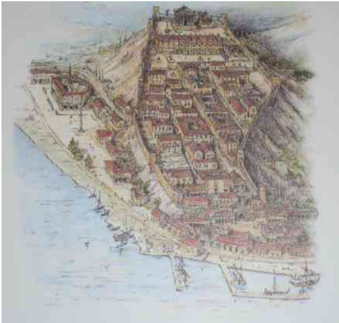
Rekonstrukcija rimskega Trsta

Sistem rimskih urbanih cest v obliki šahovnice, torej v smeri sever-jug oziroma vzhod-zahod je vsekakor razviden tudi iz poti, ki nas izpred muzeja v Semeniški ulici vodi do Rihardovega slavoloka: zavoji so zelo ostri, saj se ceste sekajo tako rekoč pravokotno.